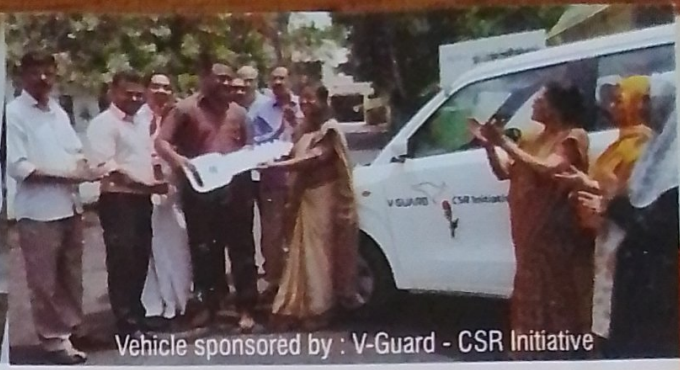
Vehicle sponsored by : V-Guard - CSR Initiative