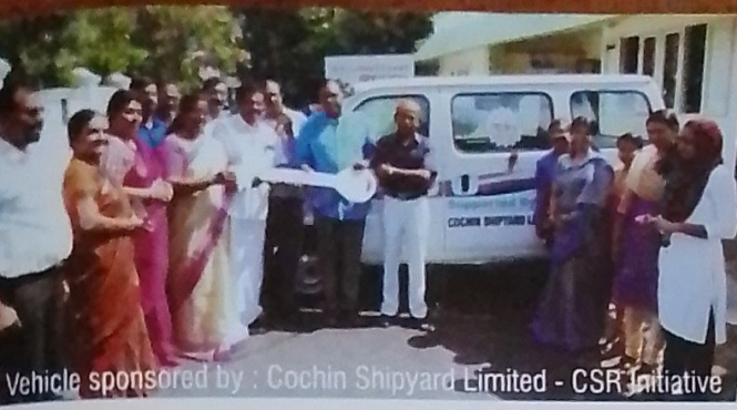
Vehicle sponsored by : Cochin Shipyard Limited - CSR Initiative