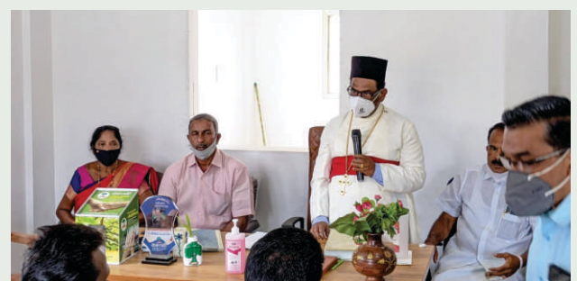
മാനവ സൗഹാർദ്ദ സംഗമം