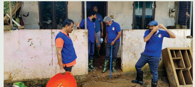
തണൽ വോളന്റിയർമാർ മുണ്ടക്കയം കുട്ടിക്കൽ ദുരന്തഭൂമിയിൽ സേവനത്തിൽ