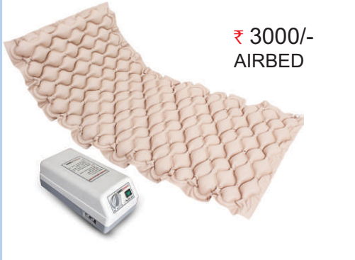
₹ 3000/- AIRBED