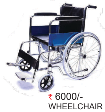
₹ 6000/- WHEELCHAIR