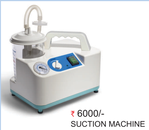
₹ 6000/- SUCTION MACHINE