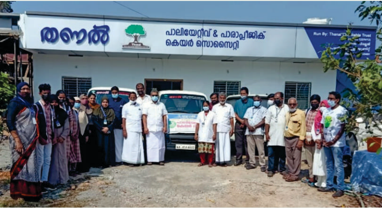
പാലിയേറ്റീവ് ദിന സന്ദേശവുമായി സ്പെഷ്യൽ ഹോംകെയറിൽ