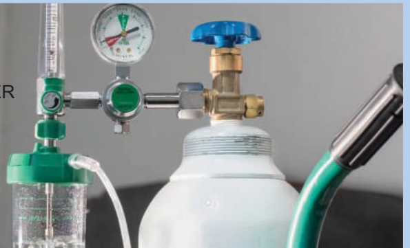
₹ 15000/- OXYGEN CYLINDER