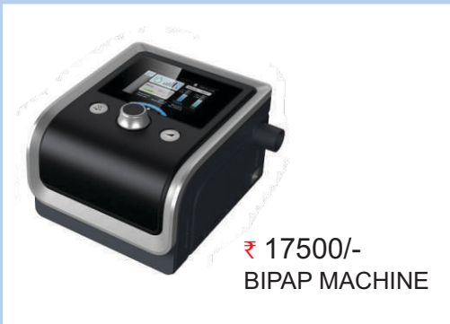
₹ 17500/- BIPAP MACHINE