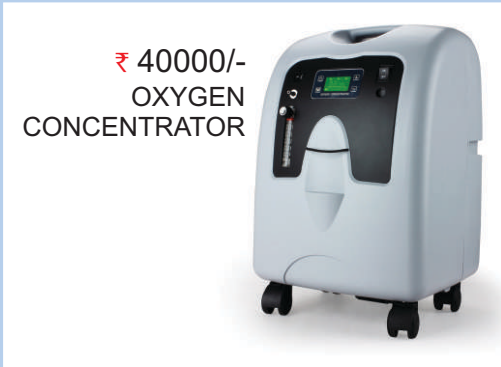
₹ 40000/- OXYGEN CONCENTRATOR