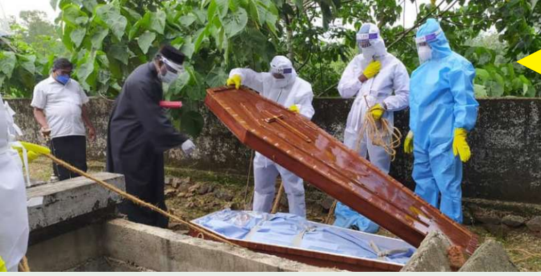
കോവിഡ് ബാധിച്ച് മരണപ്പെട്ടയാളെ തണൽ വോളന്റിയർമാർ സംസ്കരിക്കുന്നു