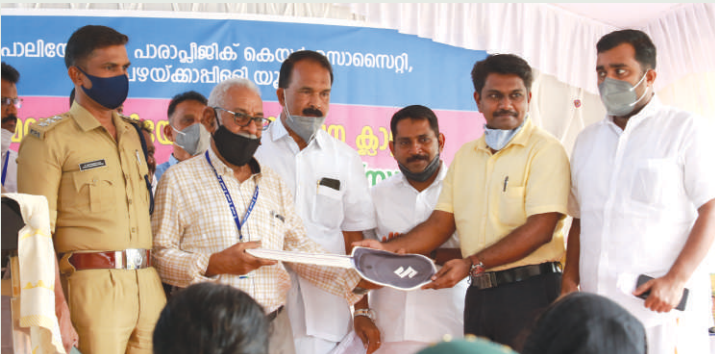
കൊച്ചിൻ ഷിപ്പാർഡ് നൽകിയ ഹോംകെയർ സർവ്വീസ് വാഹനത്തിന്റെ താക്കോൽ സി. എസ്. ആർ. ഡെപ്യൂട്ടി മാനേജർ നൽകുന്നു