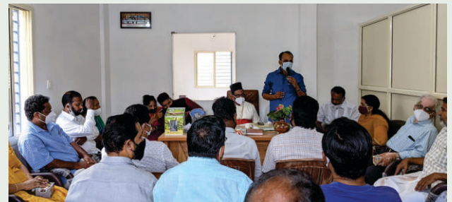
ക്രിസ്തു മസ് മത സൗഹാർദ്ദ സംഗമം