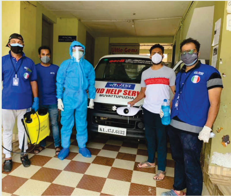
തണൽ വോളന്റിയർമാർ കോവിഡ് പ്രതിരോധപ്രവർത്തനത്തിൽ