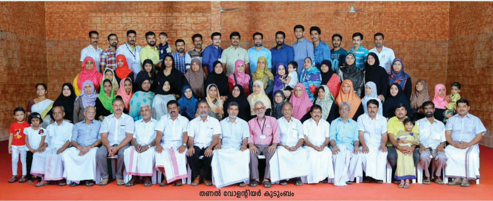
തണൽ വോളന്റിയർ കുടുംബം