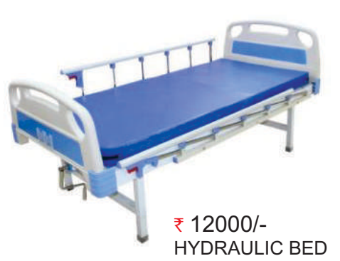
₹ 12000/- HYDRAULIC BED