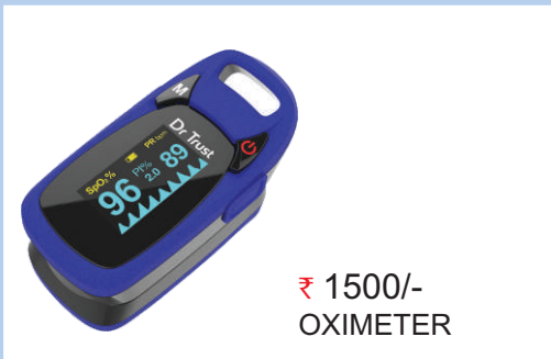
₹ 1500/- OXIMETER