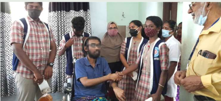
ഇസ്ലാമാടി എൻ. എസ്. എസ്. വോളന്റിയർമാർ പാലിയേറ്റീവ് രോഗിയെ സന്ദർശിച്ച് ഉപഹാരങ്ങൾ നൽകുന്നു